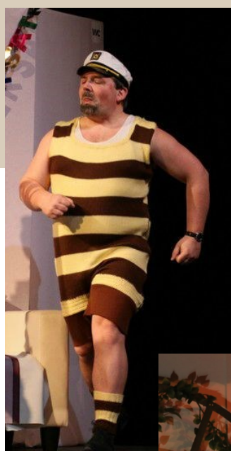
La troupe Scen' Eck