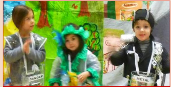
Madame danger, Madame Plastique et Monsieur Métal