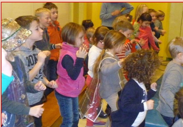
On danse avec Trituce