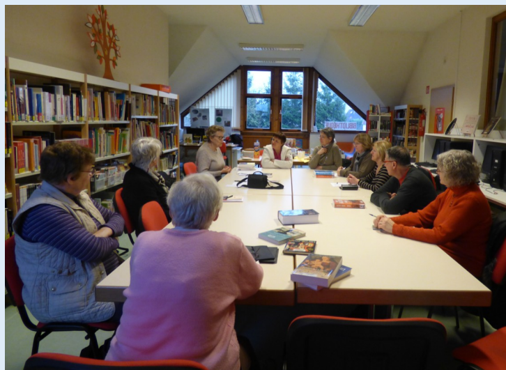
Café Lecture organisé le 17 janvier