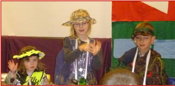
Madame Papier, Madame Verre et Monsieur Nature

Avec l'aide de Trituce, le petit extraterrestre, ils ont appris à trier les déchets pour les recycler. C'est très important pour sauvegarder notre planète !