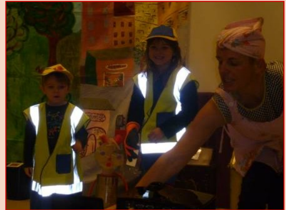
Les éboueurs et les scientifiques