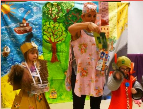
Madame Carton et l'ami de Trituce