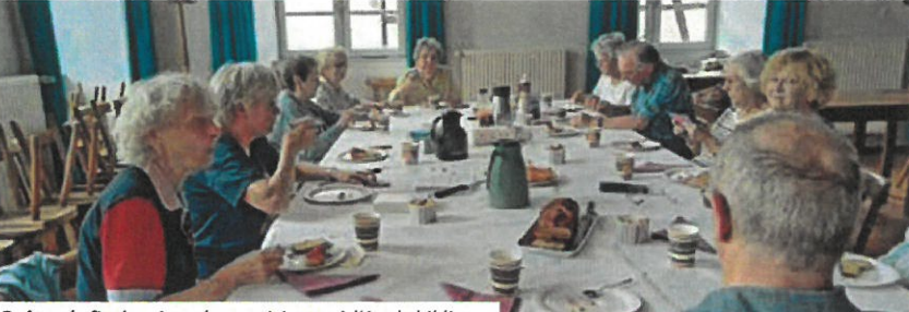
Goûter de fin de saison des participants à l'étude biblique.

Étude biblique Les prochaines rencontres auront lieu les 31 janvier et 28 février à 14h30 en salle Schweitzer.