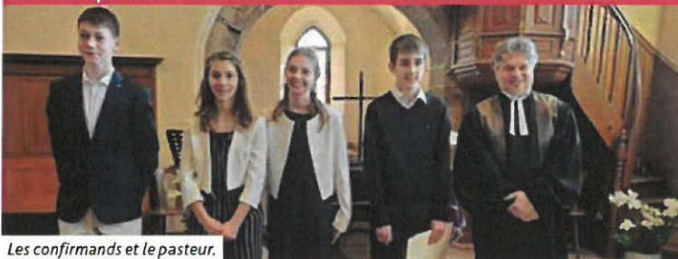
Les confirmands et le pasteur.