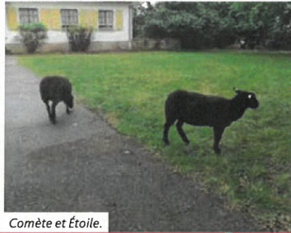
Comète et Étoile.