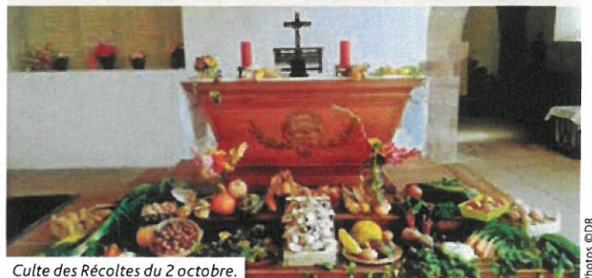
Culte des Récoltes du 2 octobre.

Comme vous pouvez le constater, la moisson a été bonne.