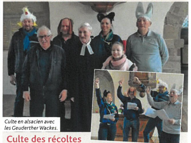
Culte en alsacien avec les Geuderther Wackes.

Un conte des frères Grimm adapté dans la langue du terroir D'Bruemther Musikante par le pasteur Georges Bronnenkant avec l'association théâtrale.