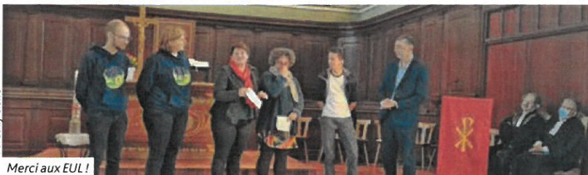
Merci aux EUL!

Cette année, une équipe des EUL (Équipes Unionistes Luthériennes) est venue célébrer et commémorer la Réformation à Brumath. Une assemblée nombreuse, s'était réunie pour l'occasion. L'équipe des EUL souhaite, à la suite de Martin Luther, être témoin de l'espérance pour aujourd'hui auprès des jeunes. Elle a invité l'assemblée à réfléchir sur la question : « De quel message d'espérance voulons-nous être le témoin ? ». Après ce temps de partage, le consistoire a, à son tour, témoigné de son soutien concret aux EUL qui ont été chaleureusement remerciées pour ce beau temps de partage et d'échange communautaire.