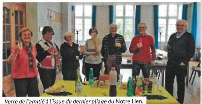
Verre de l'amitié à l'issue du dernier pliage du Notre Lien.

Avec le passage au Nouveau Messenger , nous avons tourné une page et en ouvrons une autre. La paroisse remercie chaleureusement tous les bénévoles qui ont participé à tous les processus de création et de distribution du Notre Lien et maintenant du Nouveau Messenger .