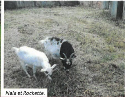
Nala et Rockette.

Tel est le mot d'ordre pour l'année 2023. Que cette parole nous accompagne durant toute cette nouvelle année qui s'ouvre devant nous. Sous le regard de Dieu, allons avec foi, espérance et amour sur le chemin de notre vie dans la certitude de la présence de Dieu à nos côtés.