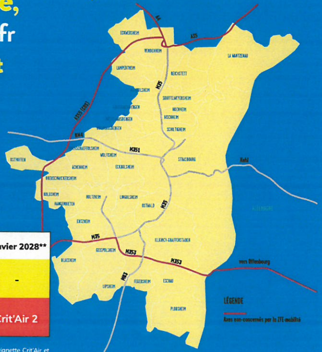
Le périmètre de la ZFE-m

Vignette Crit'Air obligatoire, demandez la sur : certificat-air.gouv.fr Aides et conseils : Agence du Climat vous conseille et vous accompagne au 03 69 24 82 82 et sur agenceduclimat-strasbourg.eu